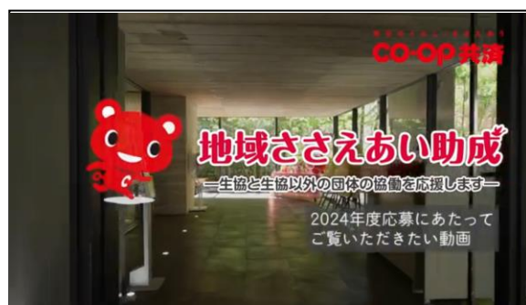
応募にあたってご覧いただきたい動画

この動画は、本助成制度にご応募を検討されている皆様にご覧いただきたいものです。応募要項の説明や応募用紙の書き方、助成決定後の流れをわかりやすく説明しています。地域において、社会課題や地域課題の解決のために地域の多様な団体と生協とのつながりを創り、広げ、協働の力でさまざまなテーマに取り組もうとされている皆様からのご応募をお待ちしています。