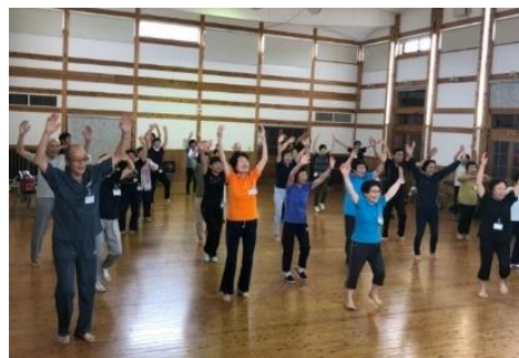
▲ひろしまGENKI体操活動の様子。

ひろしまGENKI体操の内容やエビデンス、行政との連携、 コロナ禍における参加者一人ひとりへの丁寧な関わり等 ご報告をいただきました。