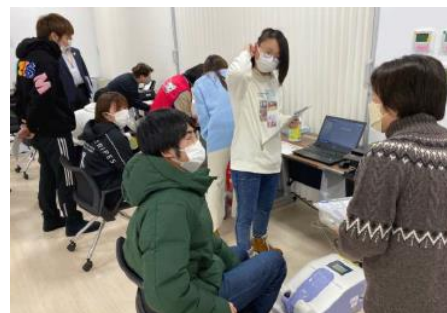
▲弘前大学生協 学生も自分事として関わり、世代を超えた交流の場を提供。

青森県内での多様な活動や、弘前大学をはじめとする学校や行政とのつながりによる活動の広がり、今後の展望としてQOL健診（生協版）についてご報告をいただきました。