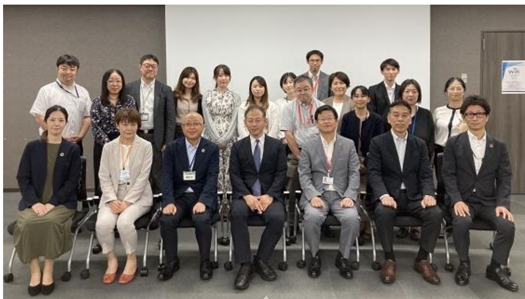
▲会場参加者の集合写真

*COI-NEXTとは、文部科学省・国研究開発法人科学技術振興機構（JST）により実施される「共創の場形成支援プログラム」のこと。