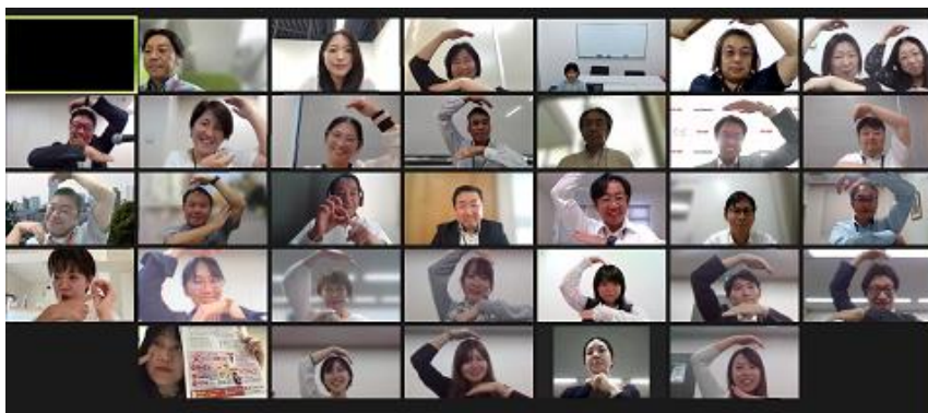
▲オンライン参加者の集合写真

・生協ひろしまの行政との連携は圧巻。「ゆる元体操」に学び、地元大学の先生と新たな体操を開発し、しっかりエビデンスもとって、参加者一人一人を大切にしている取り組みは素晴らしい。子育て中のお母さんの応援も県との連携の長い歴史の上の取り組みだと思うが、生協の参加層の世代拡大にとっても貴重な取り組みだと思う。